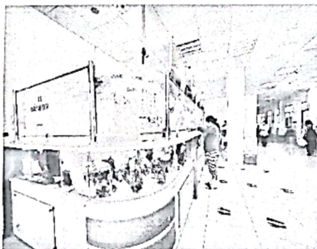
(Hình ảnh 2: Quầy đăng ký bảo hiểm y tế, dịch vụ được tách riêng, lùi về phía sau, không tạo hình oval tại sảnh chính)

- Quầy số 2, 3, 4, 5, 6 - đăng ký khám bảo hiểm y tế, vị trí trước sảnh chính bệnh viện, được di chuyển lùi về phía sau, tạo khoảng trống phía trước, không có không gian thừa bên trong khu vực làm việc