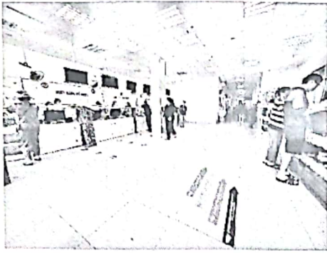
(Hình ảnh 3: Quầy đăng ký bảo hiểm y tế, dịch vụ được tách riêng, lùi về phía sau, không tạo hình oval tại sảnh chính)