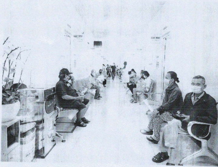
Hình ảnh 5: Vị trí người bệnh ngồi chờ khám, nhận kết quả rộng rãi, thoáng, sáng