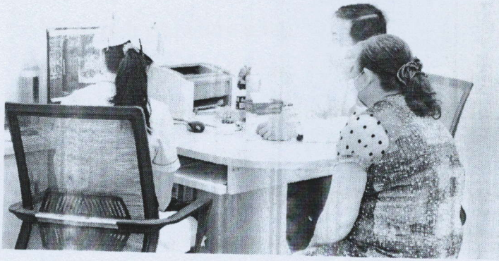
Hình ảnh 4: Vị trí người bệnh ngồi để được khám rộng rãi, thoải mái