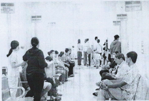
Hình ảnh 2: Khu Khám chữa bệnh chất lượng cao (Khu E) nhìn từ bên trong đến cửa ra vào