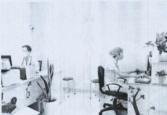
Hình ảnh 3: Khu vực làm việc của nhân viên y tế rộng rãi, ngăn nắp, gọn gàng