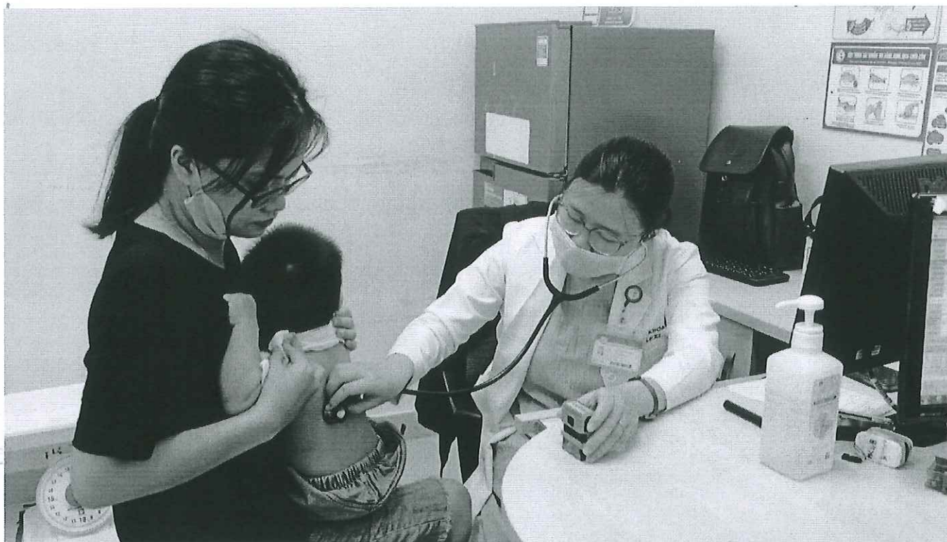
Hình ảnh 1: Bác sĩ khám cho người bệnh tại phòng khám.