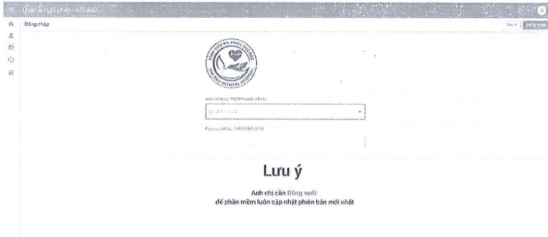
Hình ảnh 1: Giao diện đăng nhập Phần mềm quản lý nghỉ phép và chấm công bằng ứng dụng APPS SCRIPT (Phiên bản 3.0)